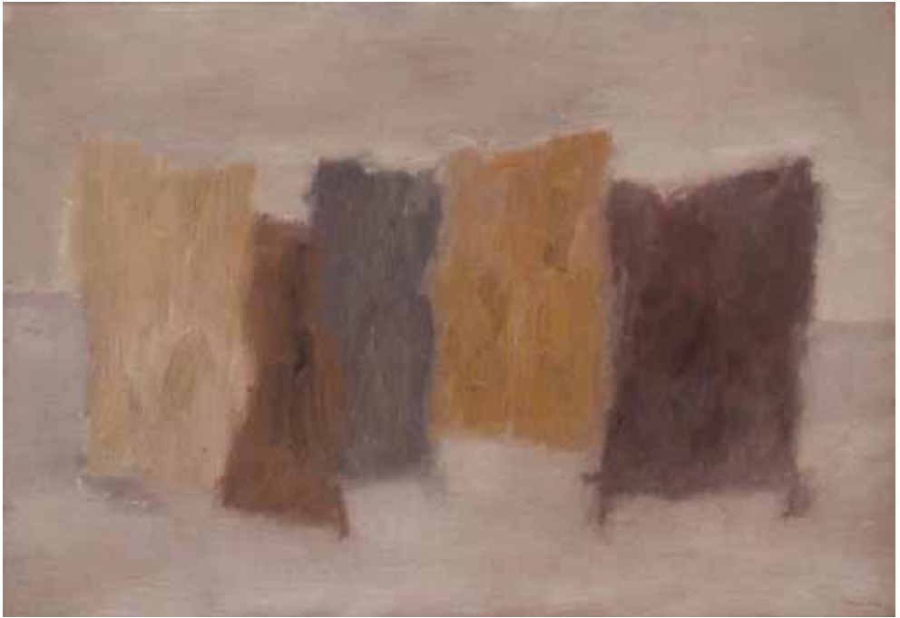
Valentino Vago Senza titolo , 1962 Olio su tela, 70 x100 cm Milano, collezione privata