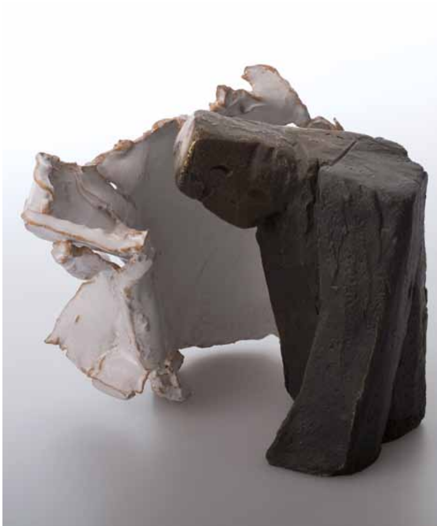
Nada Pivetta La presenza dell'altro, 2009 Bronzo, cm 14,5 x 10 x 10 - Ceramica, cm 16 x 20 x 5