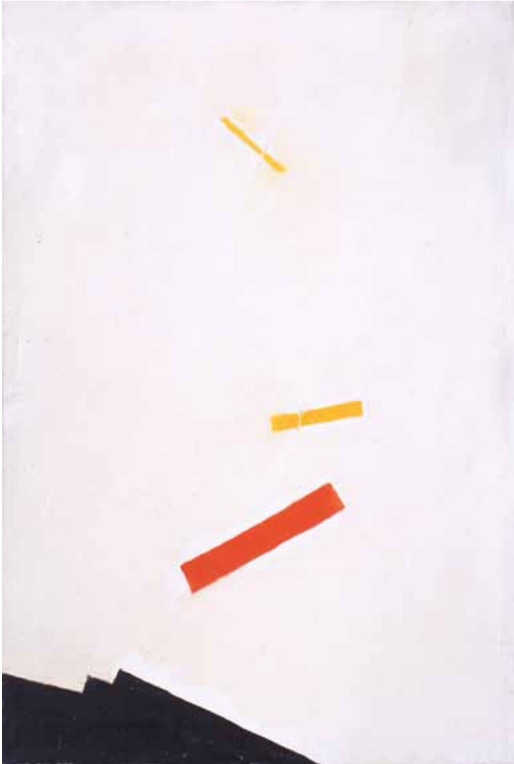
Verso l'alto, 1967 Olio su tela, cm 61 x 40