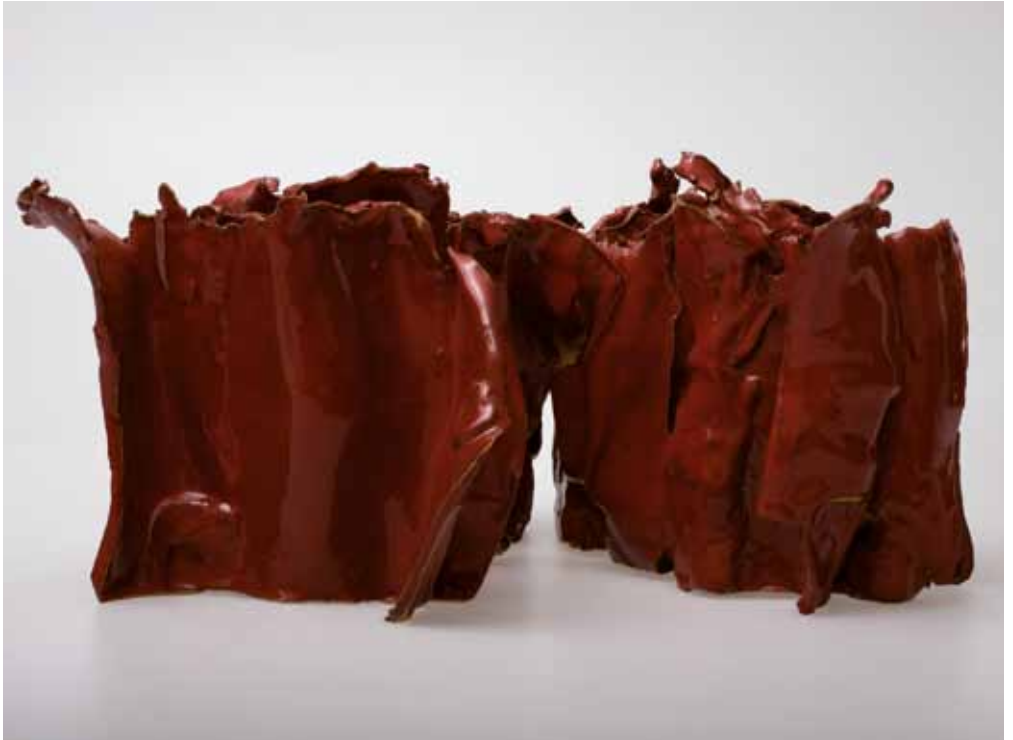
Nada Pivetta Natura rossa, 2010 Ceramica, cm 21 x 40 x 45