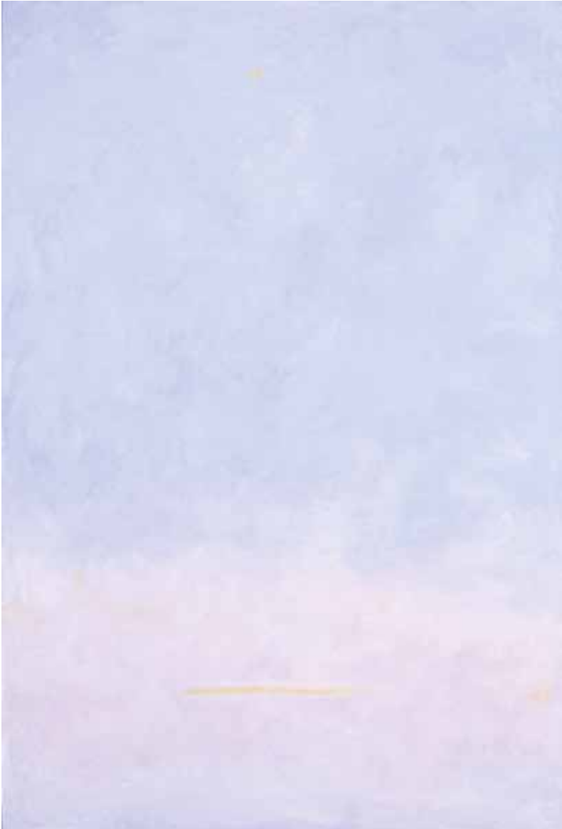
R.9 - 84, 2009 Olio su tela, cm 150 x 100