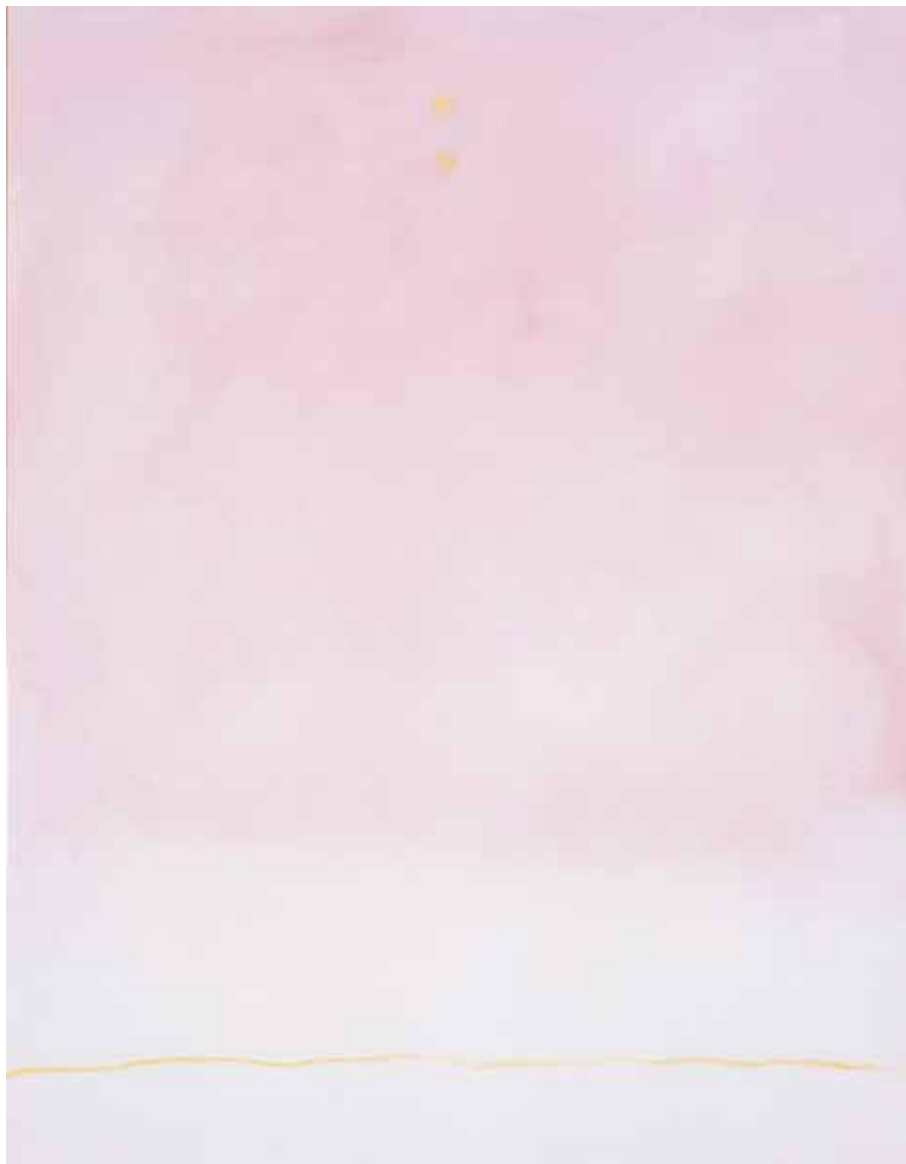
R.9 - 185, 2009 Olio su tela, cm 91 x 70