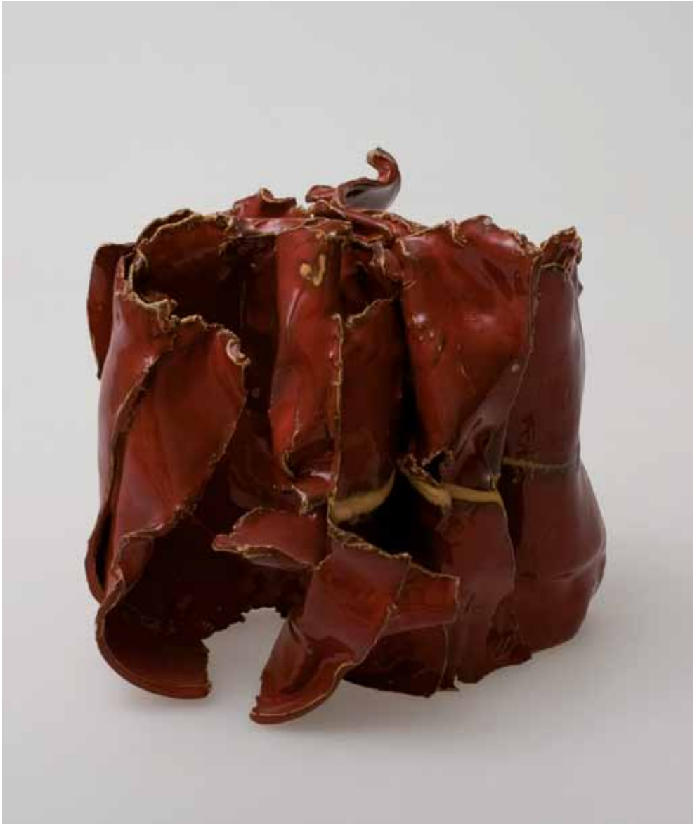
Natura rossa , 2010 Ceramica, cm 20 x 18 x 22