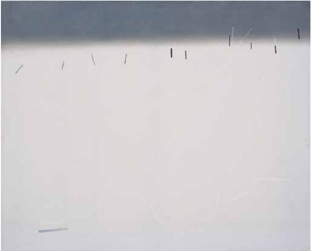
C.185, 1975 Olio su tela, cm 81 x 100