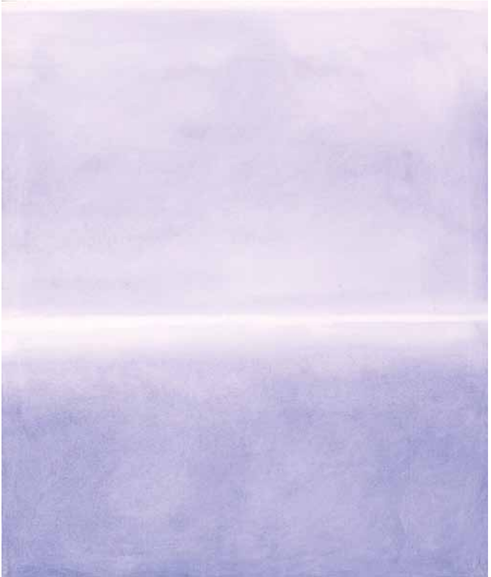
R.9 - 251 ( La luce dell'altrove ), 2009 Olio su tela, cm 71 x 60