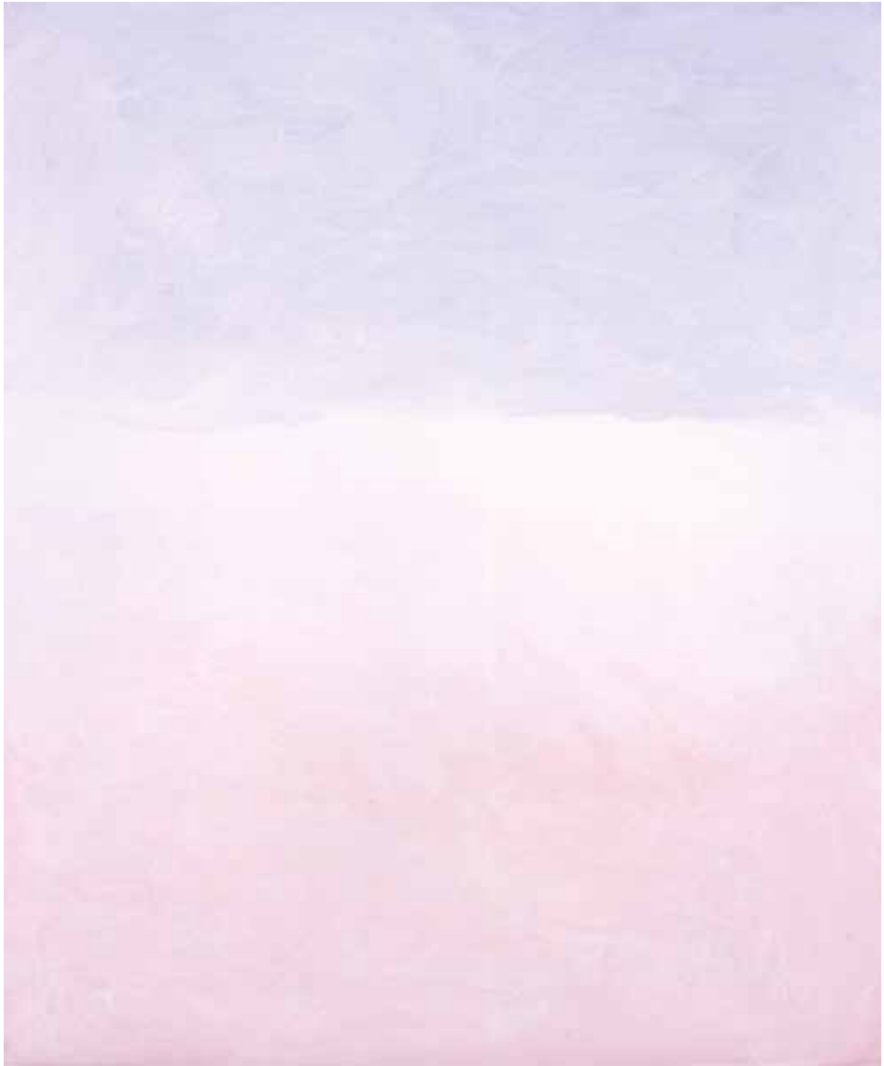
R.9 - 159, 2009 Olio su tela, cm 60 x 50