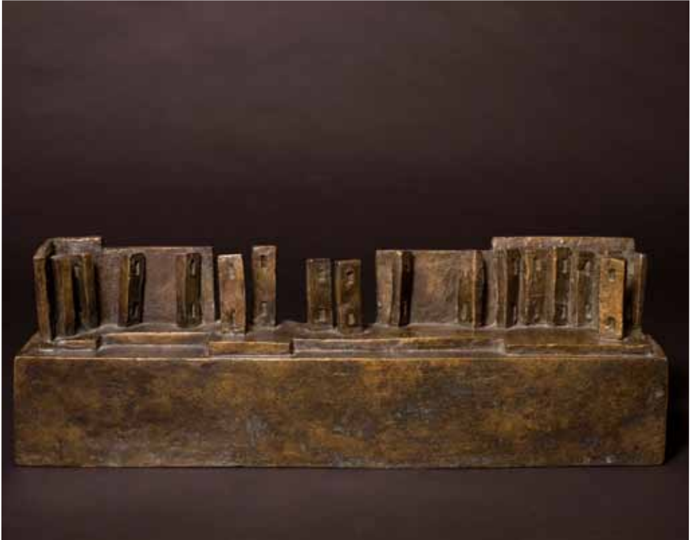
Paesaggio, 2001 Bronzo, cm 45 x 15 x 7,5