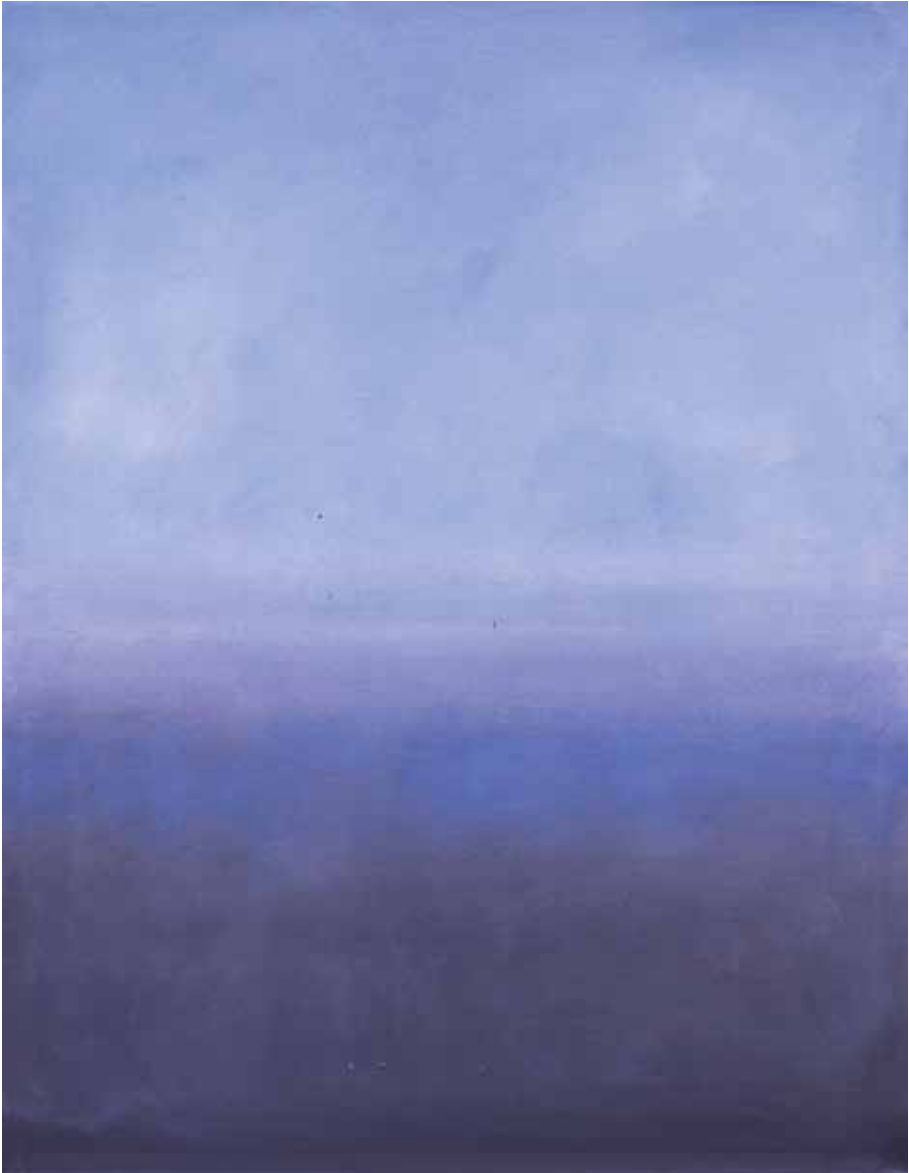
R.9 - 178, 2009 Olio su tela, cm 91 x 70