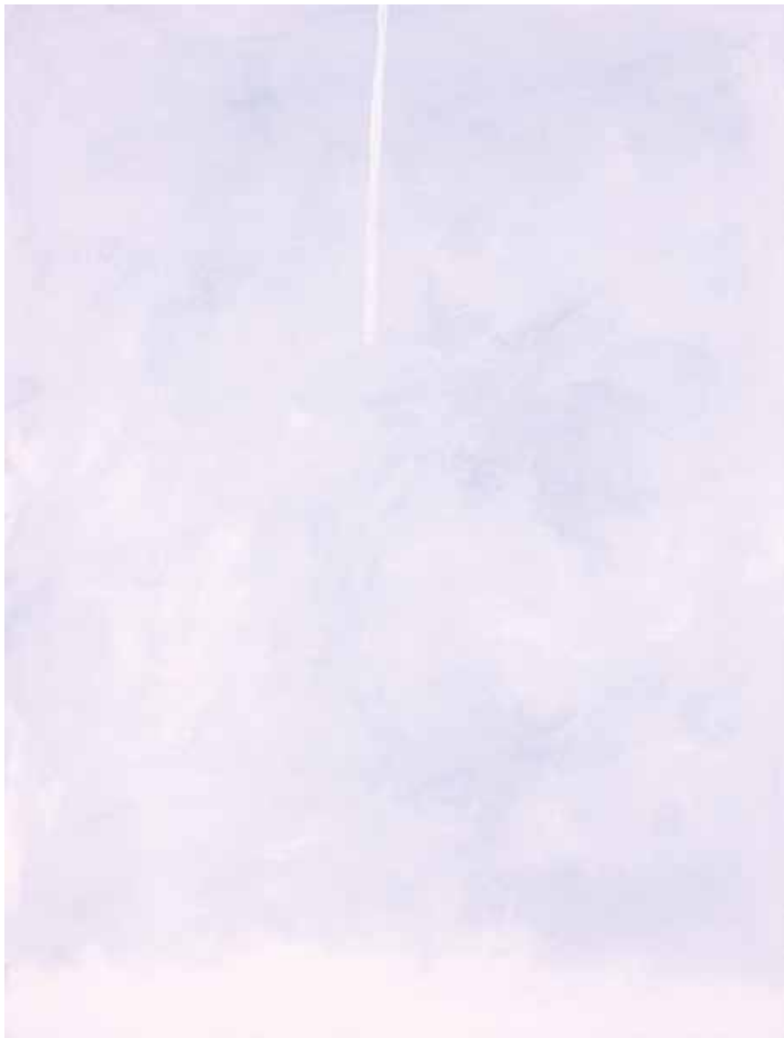
R.9 - 174, 2009 Olio su tela, cm 81 x 60