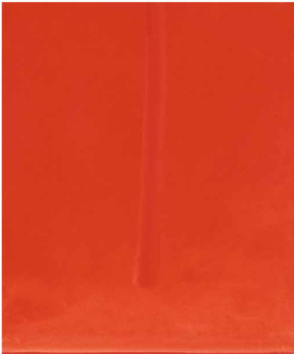
R.9 -167, 2009 Olio su tela, mm 60 x 50