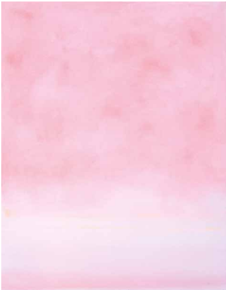
R.9 - 265 (Bellezza assoluta), 2009 Olio su tela, cm 91 x 70