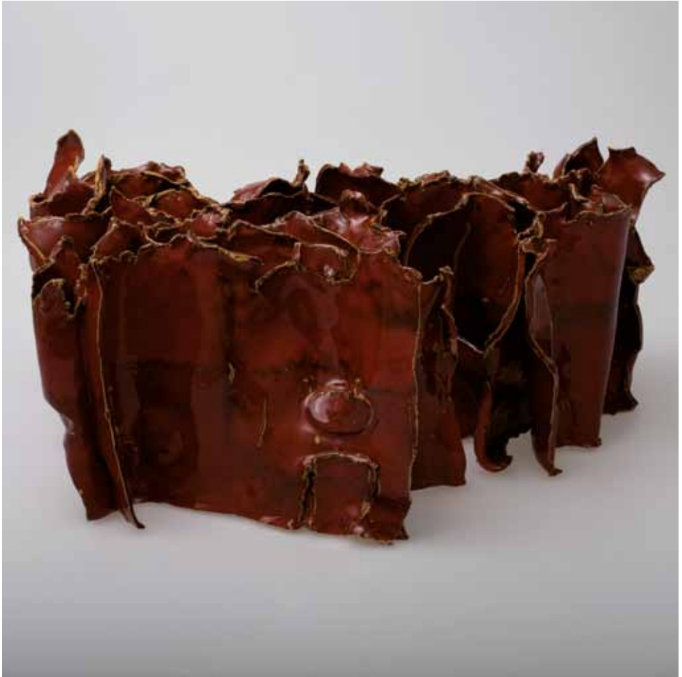
Natura rossa, 2010 Ceramica, cm 20 x 38 x 50