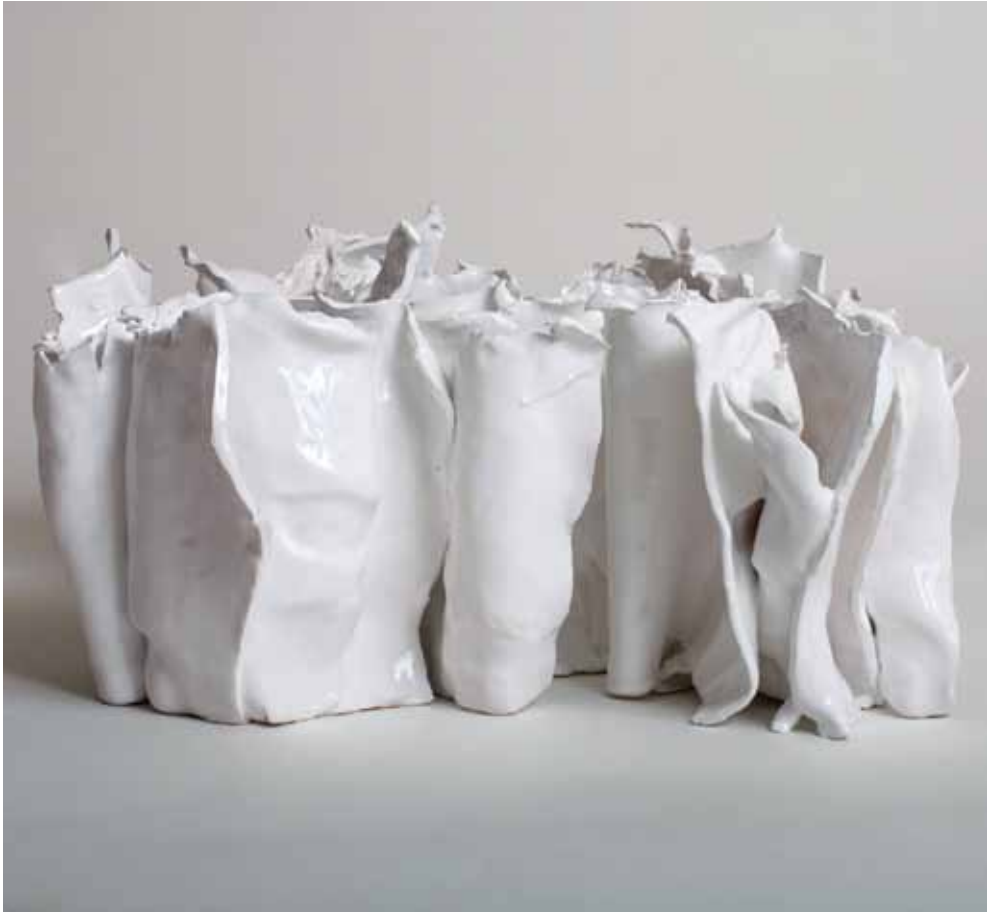
Natura bianca, 2010 Ceramica, cm 20 x 40 x 40