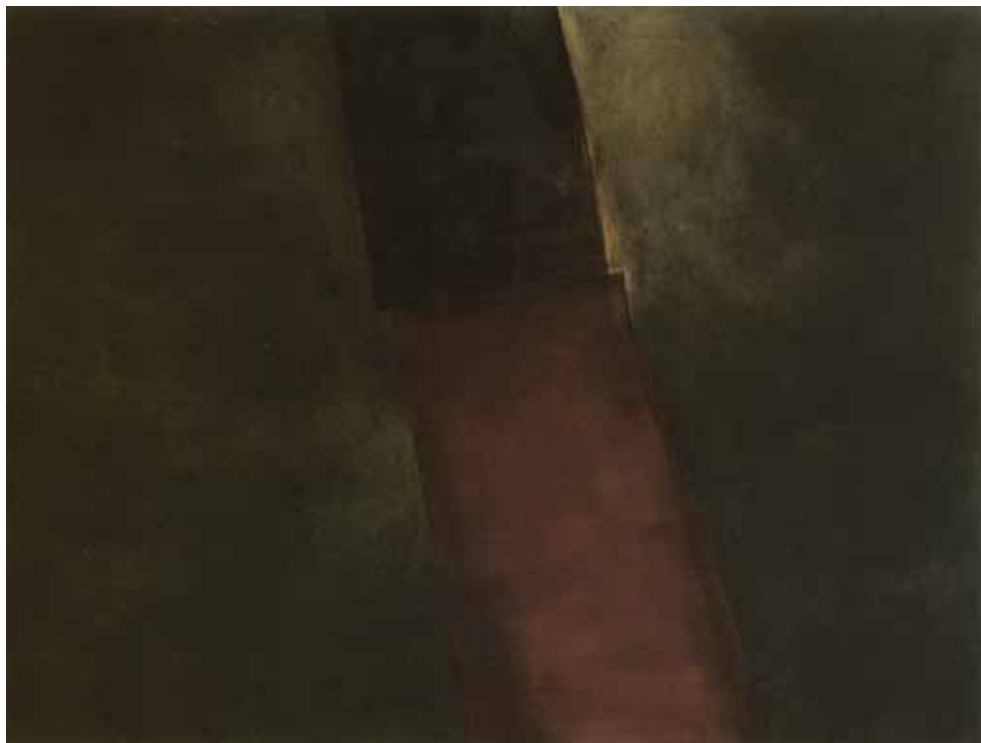
Valentino Vago R.5 - 52, 2005 Olio su tela, cm 150 x 200