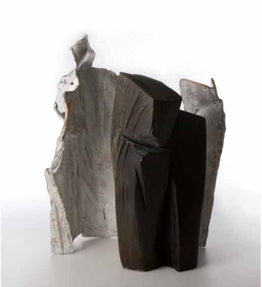
La presenza dell'altro, 2009

Bronzo, cm 45 x 59 x 31 - Legno, cm 50 x 24 x 24