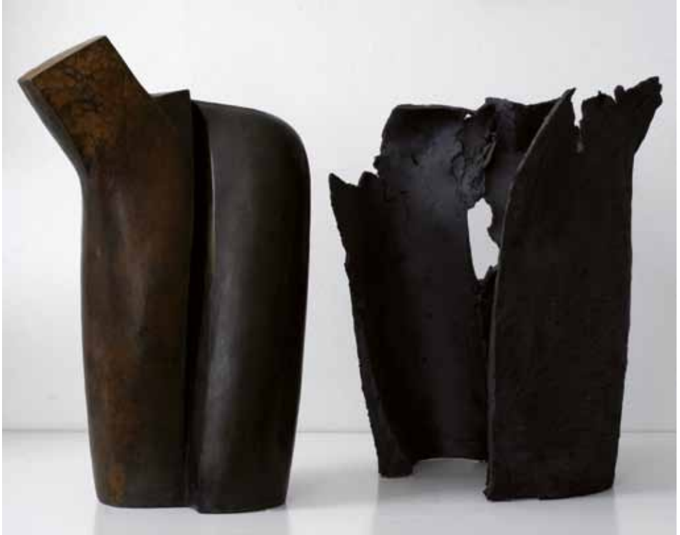
Laetoli e l'altro, 2009 Bronzo, cm 22 x 38 x 63 - Ceramica, cm 40 x 40 x 58