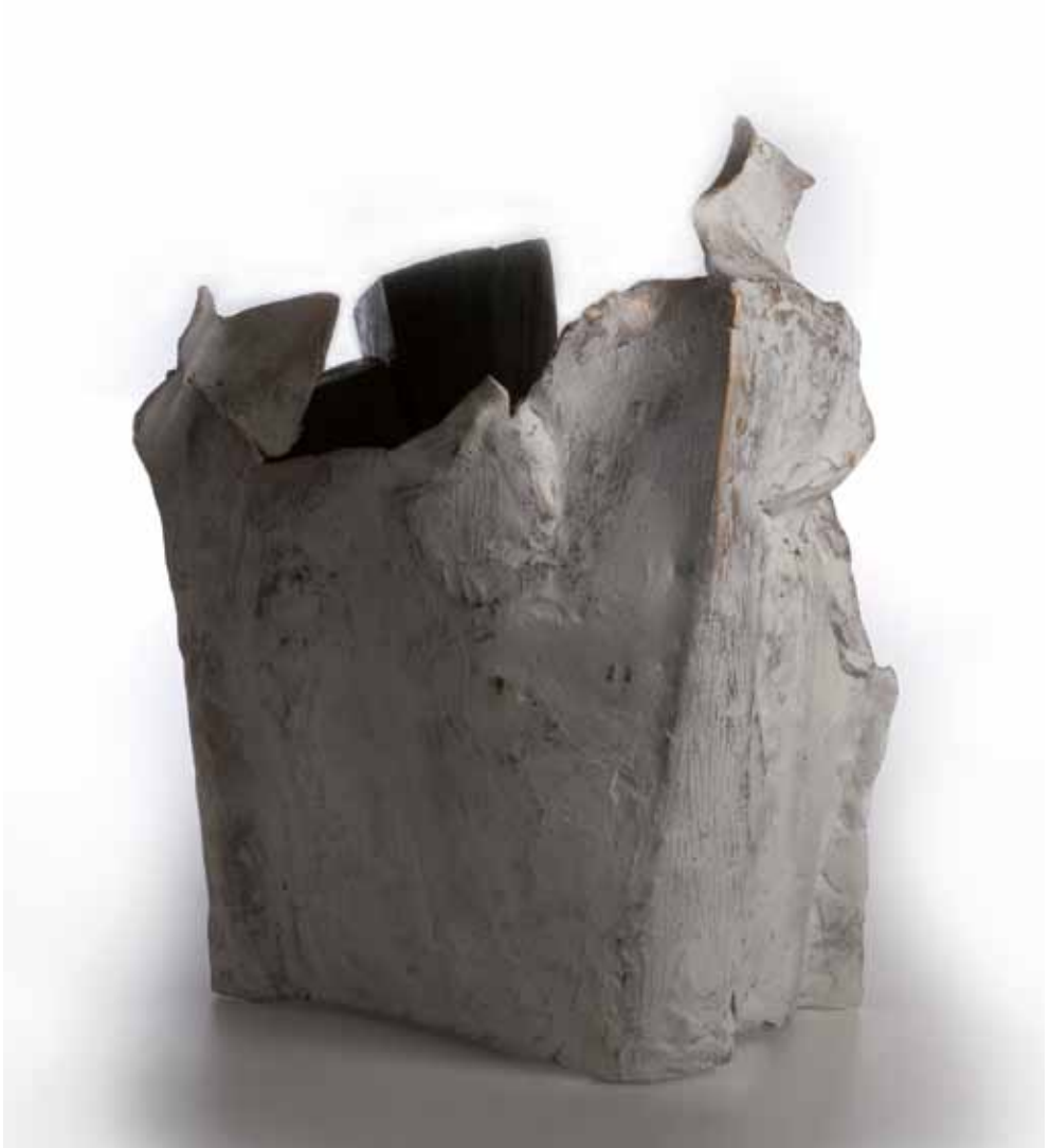
La presenza dell'altro, 2009 Bronzo, cm 45 x 59 x 31 - Legno, cm 50 x 24 x 24