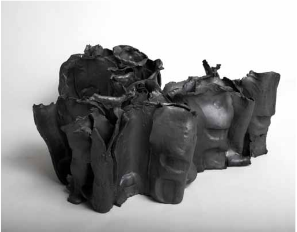
Natura nera, 2010 Ceramica, cm 31 x 40 x 30